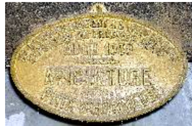
S te d'Encouragement à l'Ag re du Gers Exposition de Produits Agricoles Auch 1959 Apiculture Prix d'Honneur