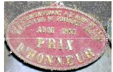
S te d'Encouragement à l'Ag re du Gers Exposition de Produits Agricoles Auch 1953 Prix d'Honneur