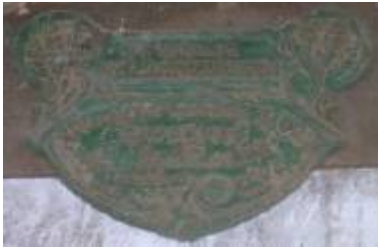
Société d'Agriculture Diplôme & Médaille d'OR Produits Agricoles Concours de Toulouse