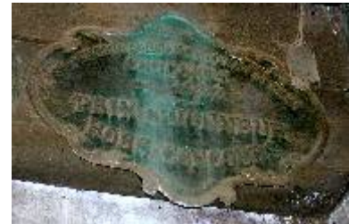
S té d'Encouragement à l'Ag re du Gers Concours de 1923 Prix d'Honneur Hors Concours