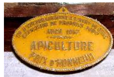
S te d'Encouragement à l'Ag re du Gers Exposition de Produits Agricoles Auch 1957 Apiculture Prix d'Honneur