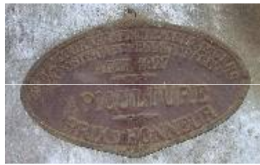
S te d'Encouragement à l'Ag re du Gers Exposition de Produits Agricoles Auch 1927 Apiculture Prix d'Honneur