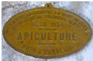
S té d'Encouragement à l'Ag re du Gers Exposition de Produits Agricoles Auch 1954 Apiculture Prix d'Honneur