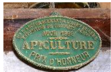
S te d'Encouragement à l'Ag re du Gers Exposition de Produits Agricoles Auch 1969 Apiculture Prix d'Honneur