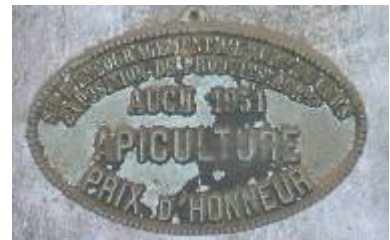
S te d'Encouragement à l'Ag re du Gers Exposition de Produits Agricoles Auch 1951 Apiculture Prix d'Honneur