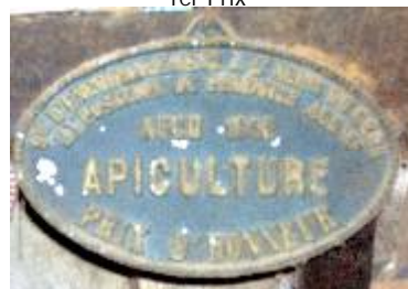
S te d'Encouragement à l'Ag re du Gers Exposition de Produits Agricoles Auch 1952 Apiculture Prix d'Honneur