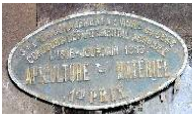
S te d'Encouragement à l'Ag re du Gers Concours départemental Agricole L'Isle-Jourdain 1953 Apiculture - Matériel 1er Prix