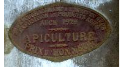
S te d'Encouragement à l'Ag re du Gers Exposition de Produits Agricoles Auch 1929 Apiculture Prix d'Honneur