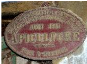
S te d'Encouragement à l'Ag re du Gers Exposition de Produits Agricoles Auch 1963 Apiculture Prix d'Honneur