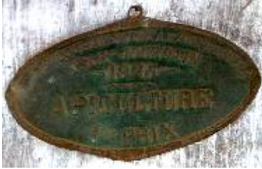
S te d'Encouragement à l'Ag re du Gers L'Isle-Jourdain 1925 Apiculture 1er Prix